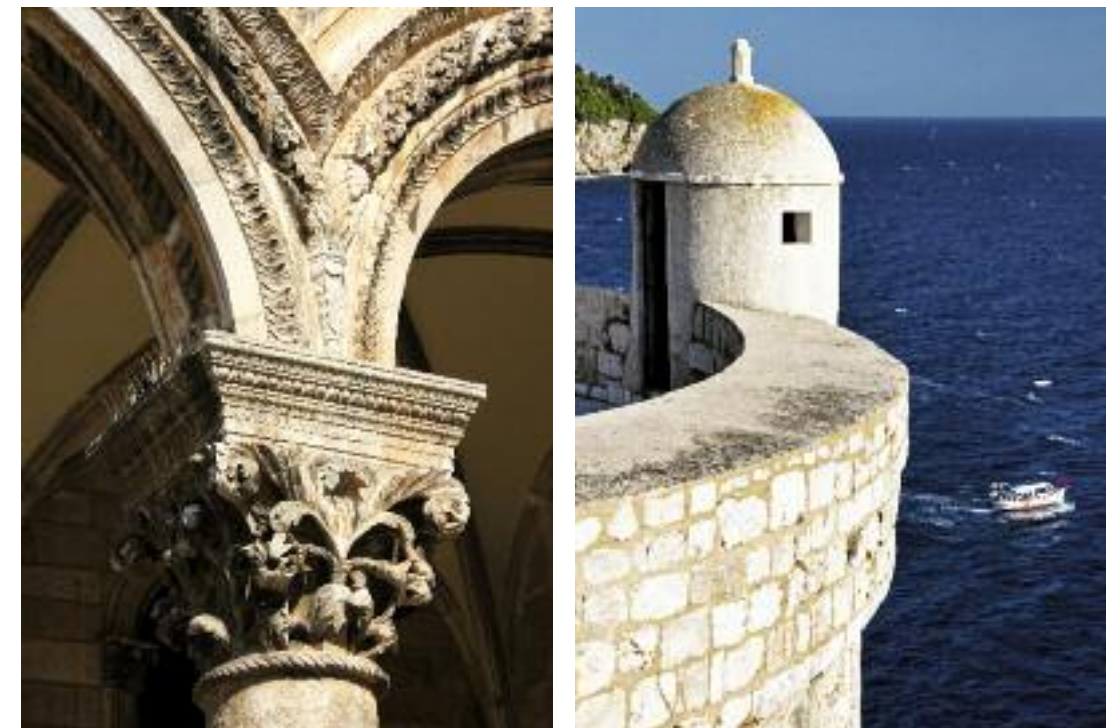
A gauche © Anton Ivanov, www.shutterstock.com A droite en haut © Dubrovnik, the Lawrence Fortress, Ivo Biocina. A droite en bas à gauche © risto0, stock.adobe.com A droite en bas à droite © tbagatic, stock.adobe.com

Dubrovnik est classé au Patrimoine Mondial de l'Unesco. Du Sun Gardens, il est possible de rejoindre la ville historique par bateau ou en voiture privée. En saison, il est conseillé de visiter la ville en fin d'après-midi lorsque les foules ont quitté les murailles.