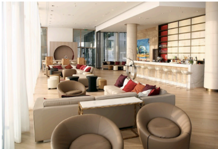
Dubrovnik Sun Gardens